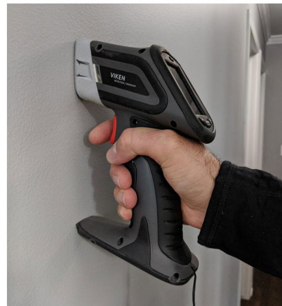
Пример прибора для рентгенофлуоресцентного анализа свинца.