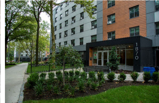
Улучшения сайта в Baychester