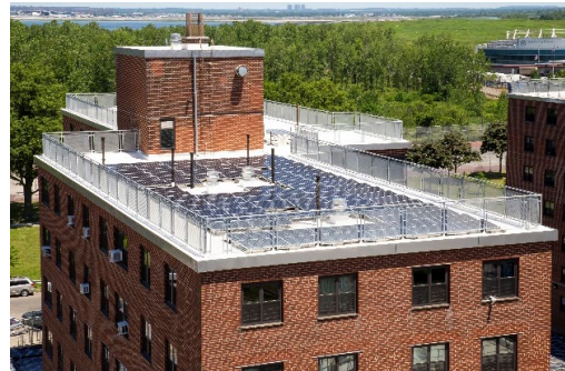
Отремонтирована крыша и система солнечных батарей в Ocean Bay (Bayside)