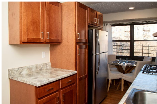
在 Twin Parks West 的翻修公寓