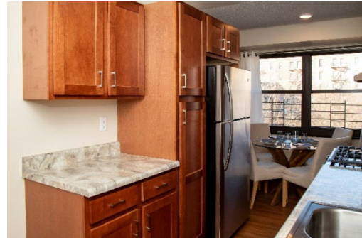
Apartamento renovado en Twin Parks West Mejoras en el sitio en Baychester