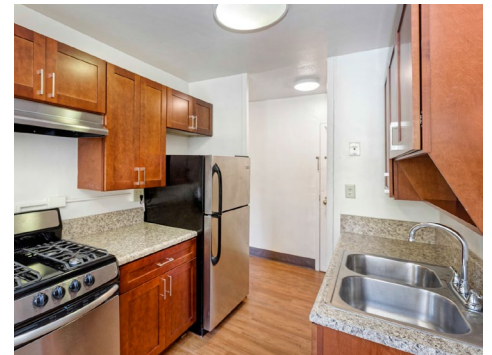
Ocean Bay (Bayside)