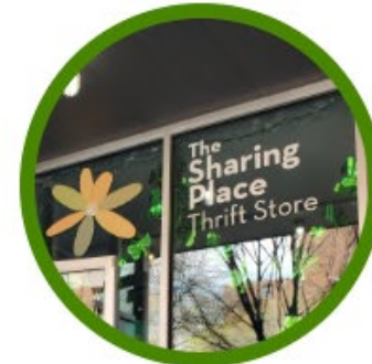
TIENDA DE SEGUNDA MANO THE SHARING PLACE