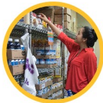
SERVICIOS DE APOYO FAMILIAR