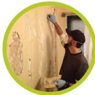
SERVICIOS DE SALUD AMBIENTAL