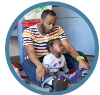
SERVICIOS DE SALUD MENTAL