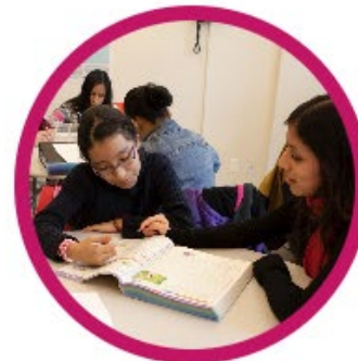
ENRIQUECIMIENTO PARA K-5