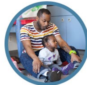
УСЛУГИ ПСИХИЧЕСКОГО ЗДОРОВЬЯ