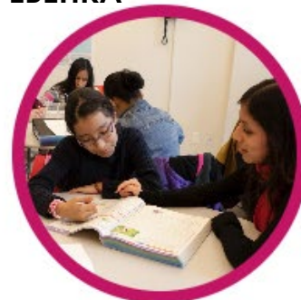
РАСШИРЕНИЕ НАВЫКОВ К-5