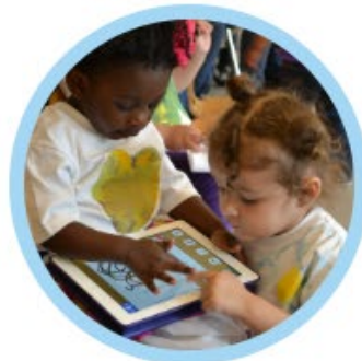
ВОСПИТАНИЕ И РАЗВИТИЕ РЕБЕНКА