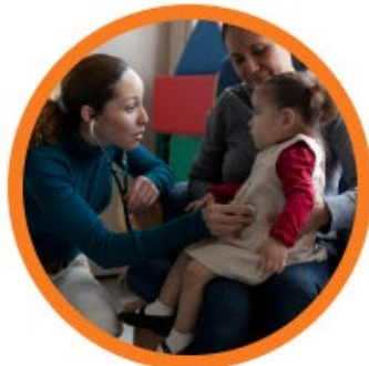
ЗДОРОВЬЕ МАТЕРИ И МЛАДЕНЦА