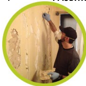
УСЛУГИ ГИГИЕНЫ ОКРУЖАЮЩЕЙ СРЕДЫ