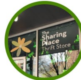
THE SHARING PLACE THRIFT STORE