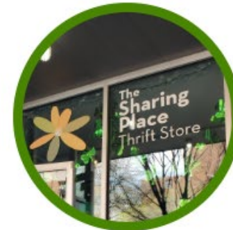
THE SHARING PLACE THRIFT STORE