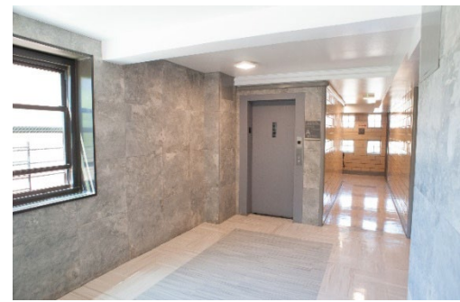
Ocean Bay (Bayside) 的翻新建筑入口