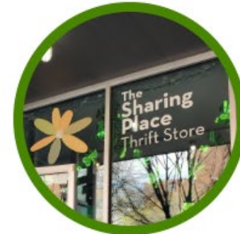
THE SHARING PLACE THRIFT STORE