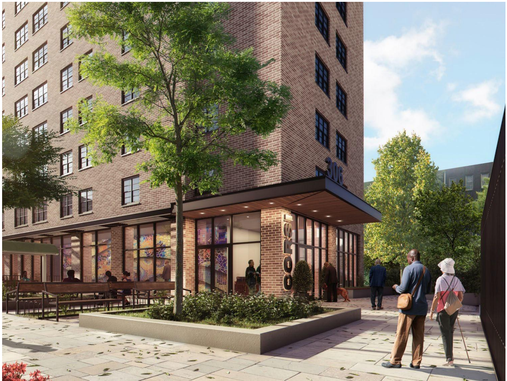
大堂入口、开放式户外空间、带围栏的周边