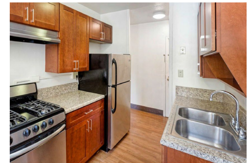
Ocean Bay (Bayside)