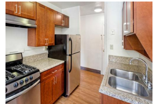
Ocean Bay (Bayside)